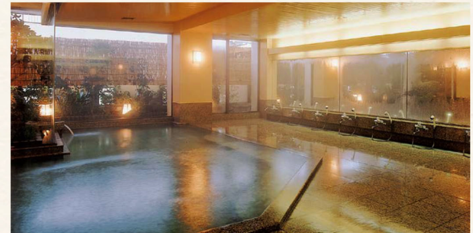
殿方大浴場「天神の湯」Tenjin-no-Yu