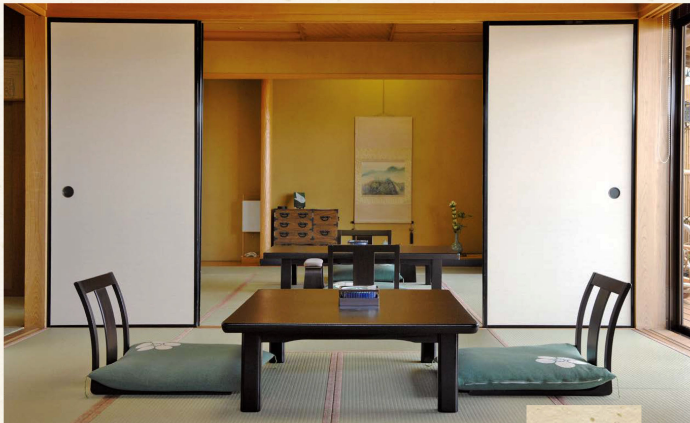
東館 海悠亭 Kaiyu-tei

「海悠亭」のお部屋には、檜で造られた 専用露天風呂をご用意しております。 刻々と表情を変えてゆく海の眺めをお楽しみください。