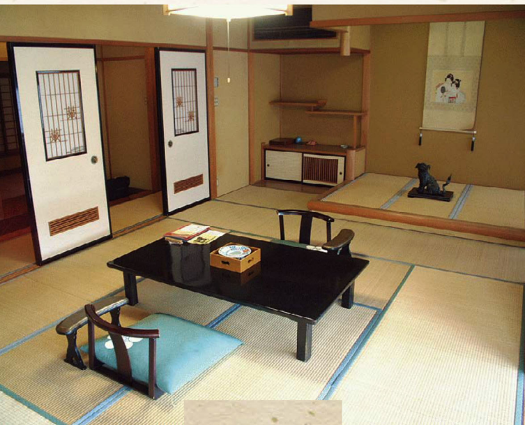
南館 懐心亭 Kaishin-tei

「懐心亭」は、風情溢れる木造りのお部屋で、 月見台のあるお部屋もございます。 京風数寄屋造りの心地よさをご堪能ください。