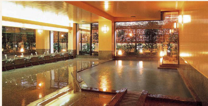
御婦人大浴場「平戸の湯」Hirato-no-Yu

Our own private-sourced hot spring boasts a supply of hot water at a scorching 59℃, which is one of the best hot-spring in Atami. The name “Hirato” “Tenjin” is derived from the Hirato Tenmangu Shrine, which is laid in our property.